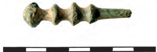
Ryc. 2. Pasieki, gm. Tomaszów Lubelski. Główkę szpili brązowej