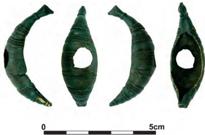
Ryc. 2. Fragment zapinki brązowej odnaleziony pomiędzy Topornicą i Lipskiem Abb. 2. Fragment einer zwischen Topornica und Lipsko gefundenen Bronzefibel

VII stulecia przed Chrystusem (M. Trefný 2000, s. 367). Okazy ze stanowiska Smolenice-Molpír miały przypadać na starszy odcinek wczesnej epoki żelaza i początki odcinka młodszego (M. Novotná 2001, s. 85–85, Taf. 31), albo pochodzić z końca okresu HaC, który wedle korekty Hermanna Parzingera opartej m.in. o daty bezwzględne halsztackich zespołów z terenów alpejskich, mieścił się w przedziale 640–620 p.n.e. (H. Parzinger 1989, s. 102, 105). Wydaje się zatem, że podobnie jak ozdoby ze Smolenic, zabytek odkryty pomiędzy Lipskiem a Topornicą może być umieszczany w starszym odcinku wczesnej epoki żelaza i w tym kontekście należałby do najwcześniejszych zapinek złożonych z kabłąka, sprężyny, igły i pochewki, znalezionych na ziemiach polskich, a już na pewno byłby najwcześniejszą zapinką o łódkowatym kabłąku.