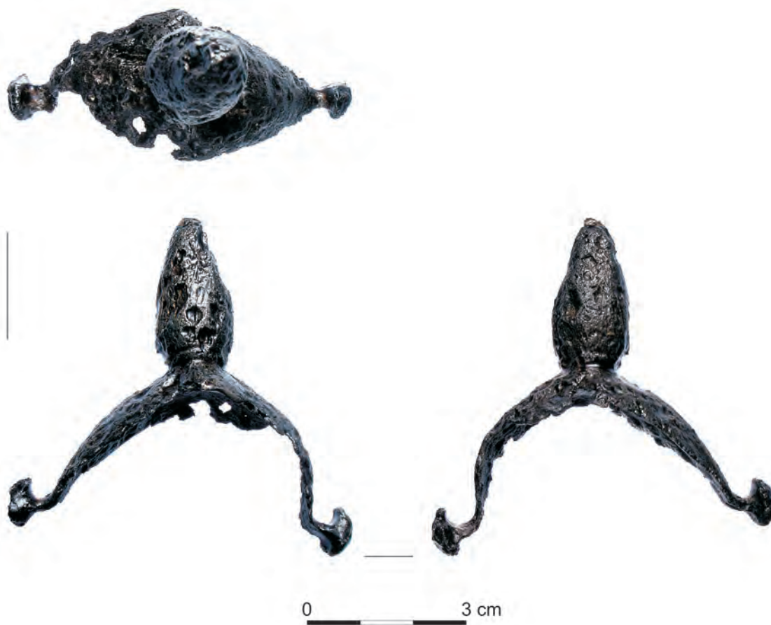
Ryc. 2. Ostroga z Międzybrodzia (pow. Sanok) Abb. 2. Sporn aus Międzybrodzie (pow. Sanok)