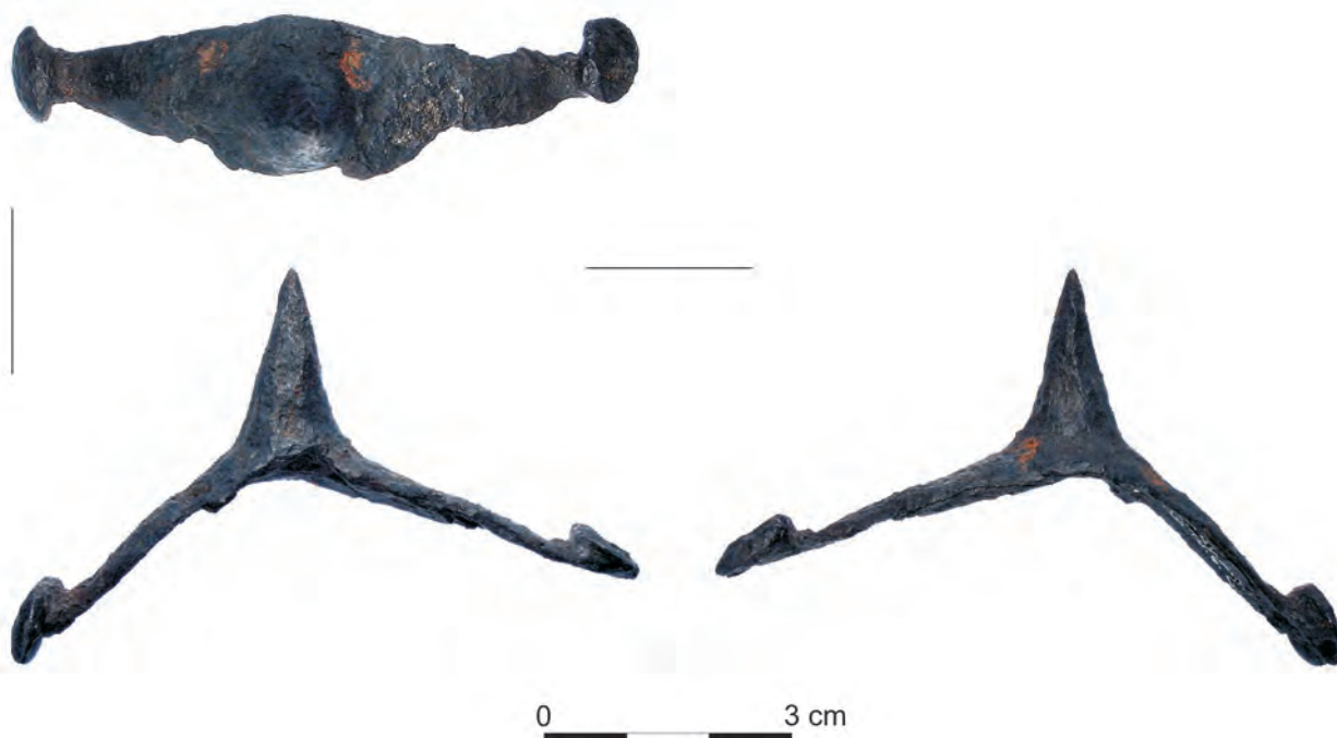
Ryc. 3. Ostroga ze wzgórza zamkowego w Sanoku Abb. 3. Sporn vom Burghügel in Sanok