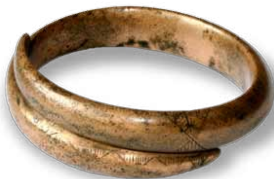
Ryc. 2. Turkowice, pow. hrubieszowski – bransoleta brązowa. Fot. S. Sadowski Abb. 2. Turkowice, Kr. Hrubieszów – Bronzearmring. Fot. S. Sadowski