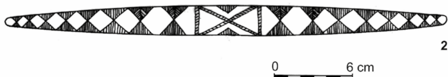
Ryc. 1. Turkowice, pow. hrubieszowski – bransoleta brązowa (1), rekonstrukcja ornamentu (2). Rys. E. M. Kłosińska Abb. 1. Turkowice, Kr. Hrubieszów – Bronzearmring (1), Rekonstruktion des Verzierungsmotivs (2). Zeichn. E. M. Kłosińska