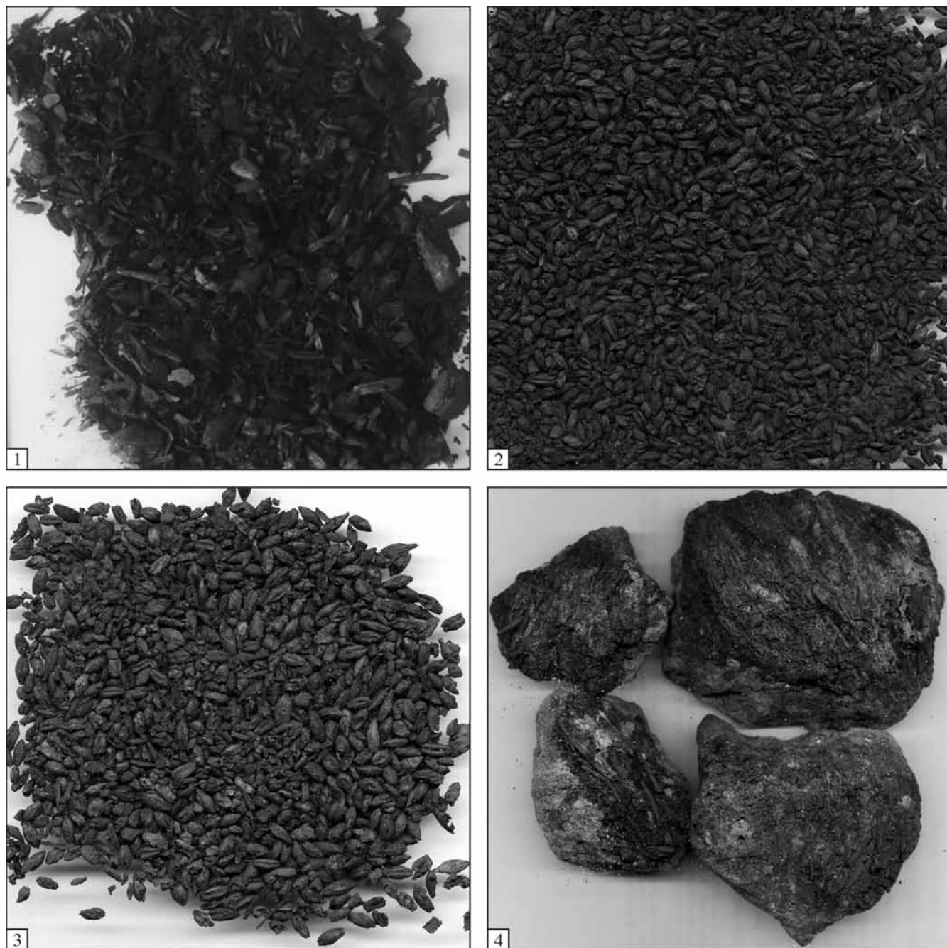
Рис. 5. Палеоботанічні матеріали із заповнення об'єкта № 14 на софіївсько-борщагівському селищі: 1, 2 – проба I (1 – органічні рештки, здебільшого трав'янисті; 2 – переважно ячмінь плівчастий); 3 – проба II, ячмінь плівчастий; 4 – проба III, глиняна обмазка з перепаленими стеблами трави