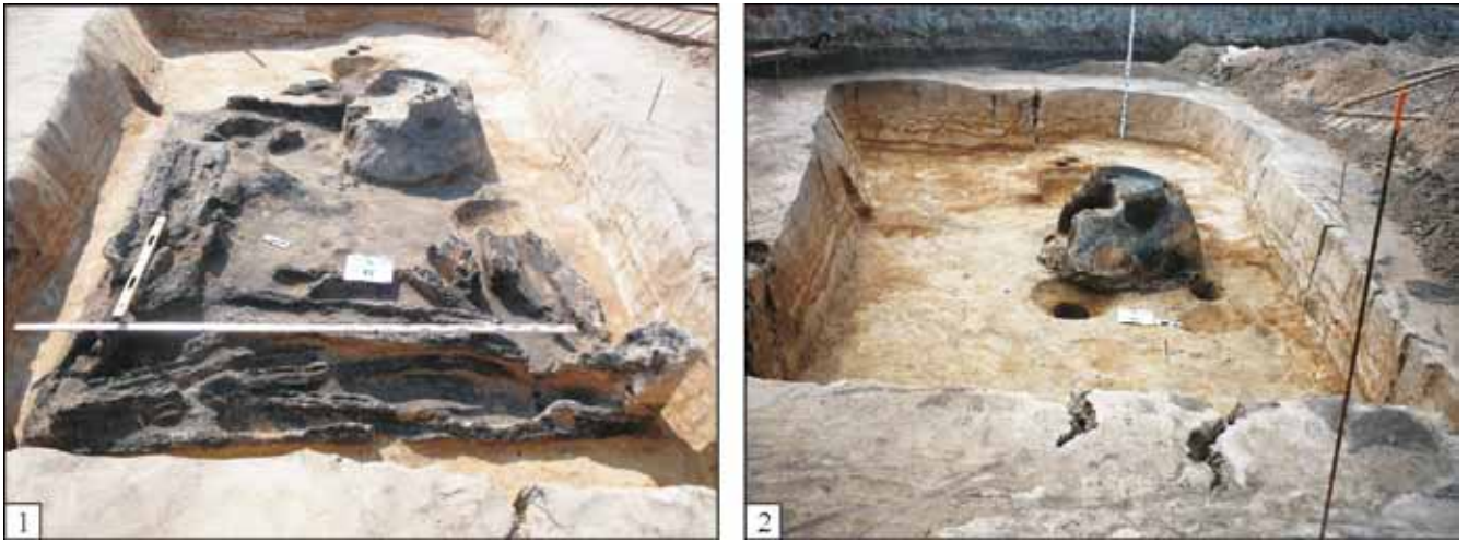
Рис. 2. Об'єкт № 14 з розкопу III поселення Софіївська Борщазівка на етапі розчистки решток дерев'яних конструкцій (1) та після вибирання заповнення (2), вигляд зі сходу Fig. 2. Feature No 4, the trench III of Sofijiwska Borszczagiwka settlement, the stage of exploring the remains of wooden structures (1) and after the removal of the wood constructions (2); a view from the east

Проба III взагалі не має палеоетноботанічної цінності, оскільки не містить зернових (рис. 5: 4).