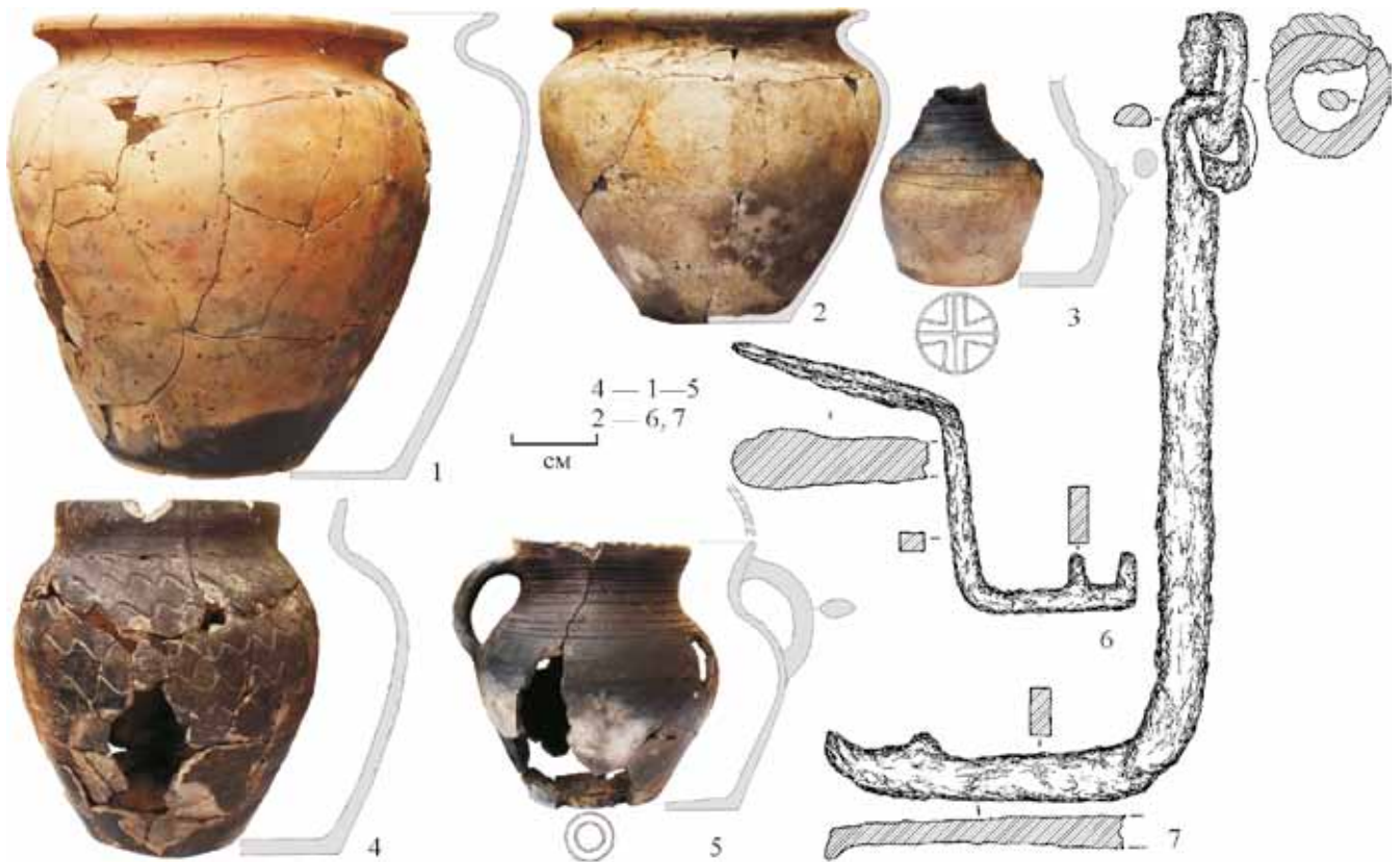
Рис. 3. Зразки посуду (1–5) та залізні ключі (6, 7) із заповнення об'єкта Fig. 3. A selection of vessels (1–5) and iron keys (6, 7) coming from the feature fill

нового господарства чи деревообробної справи, оскільки їх склад загалом властивий давньоруським пунктам. Водночас, привертають увагу місця фіксації матеріалів. Проба I виявлена у південно-східному куті об'єкта, розташованому навпроти входу по діагоналі від печі. Відомо, що на формування стереотипу житлового середовища впливає як матеріальне, так і духовне життя народу і кожний реальний будинок виступає практичним втіленням цього стереотипу як цілісної системи взаємопов'язаних елемен-